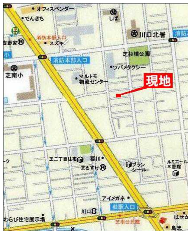
ゼンリン住宅地図「川口・蕨」西部版<P31F3>